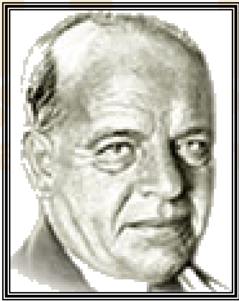
9/1/1973 - 4/7/1934